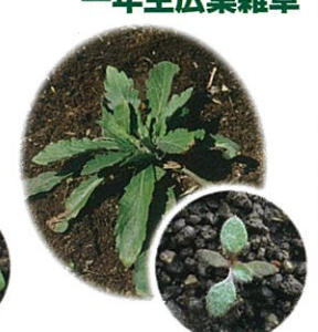
アレチノギク (幼齢期)