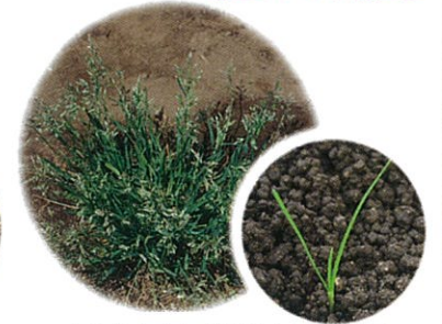
スズメノカタビラ (幼齢期)