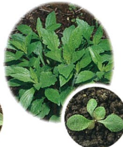
ヒメジョオン (幼齢期)