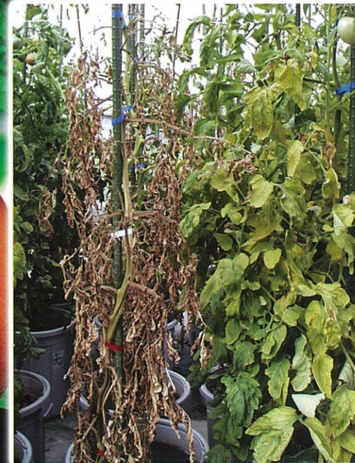
センチュウ被害を受けた地上部