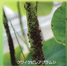
クワイクヒレアブラムシ