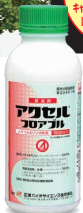
〈写真はイメージです〉