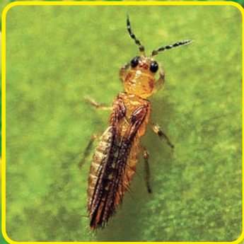
チャノキイロアザミウマ