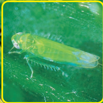
チャノミドリヒメヨコバイ