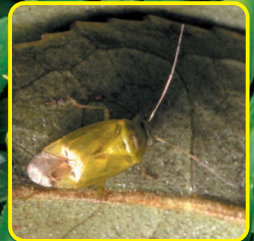
ツマグロアオカスミカメ