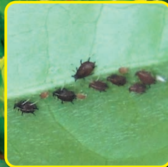
コミカンアブラムシ