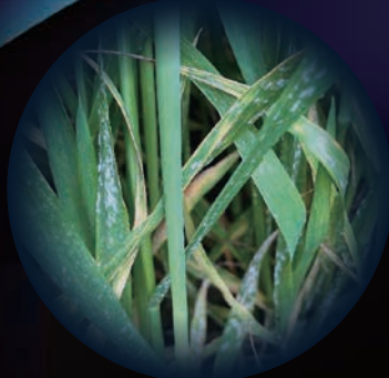
うどんこ病を発症している小麦